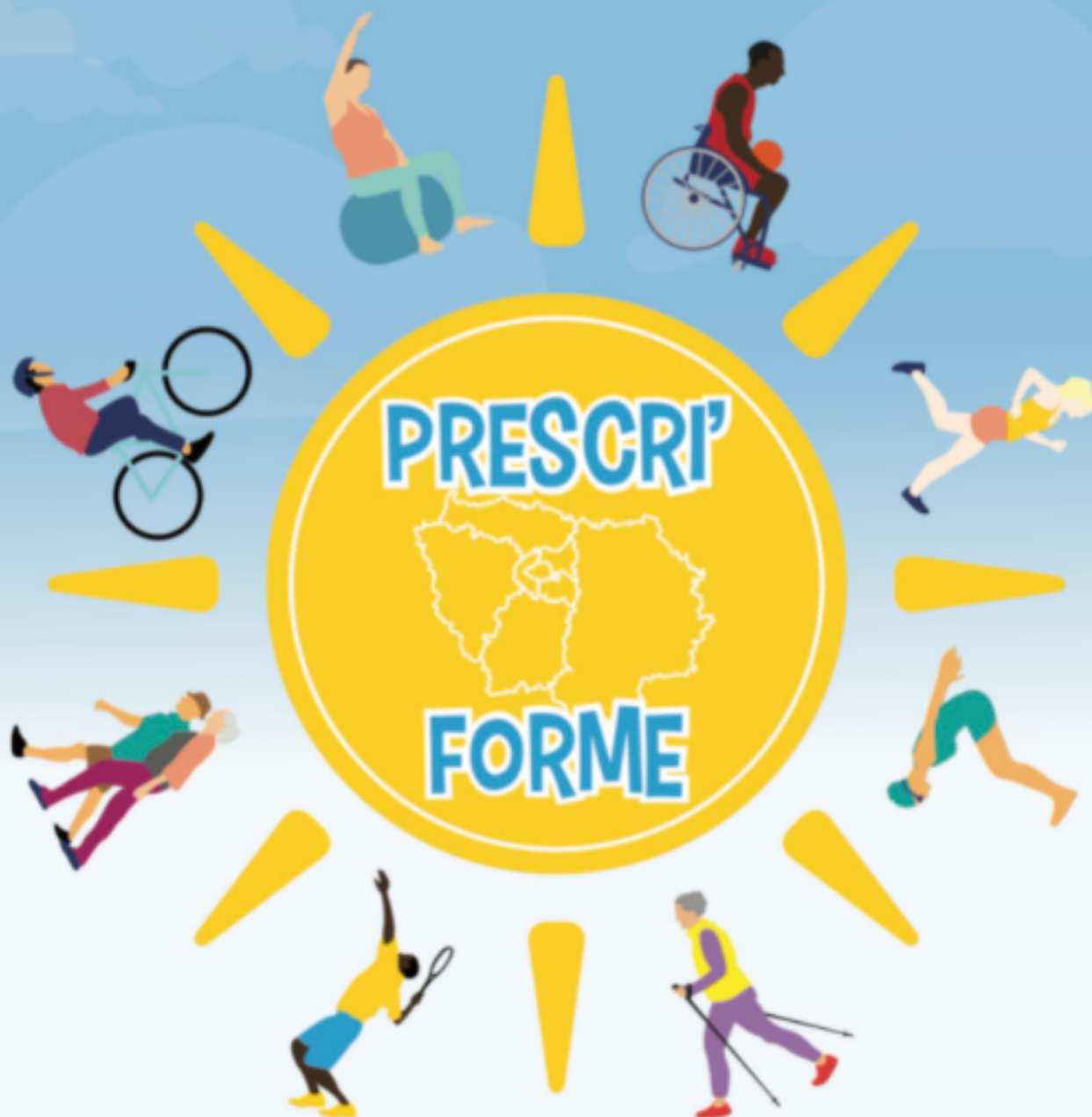
Illustration graphique : Pierre Fabre