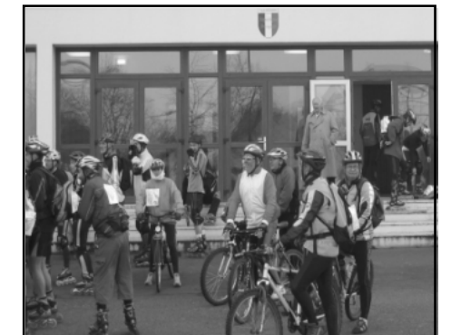
Cyclistes et rollers, au départ d'Etampes !